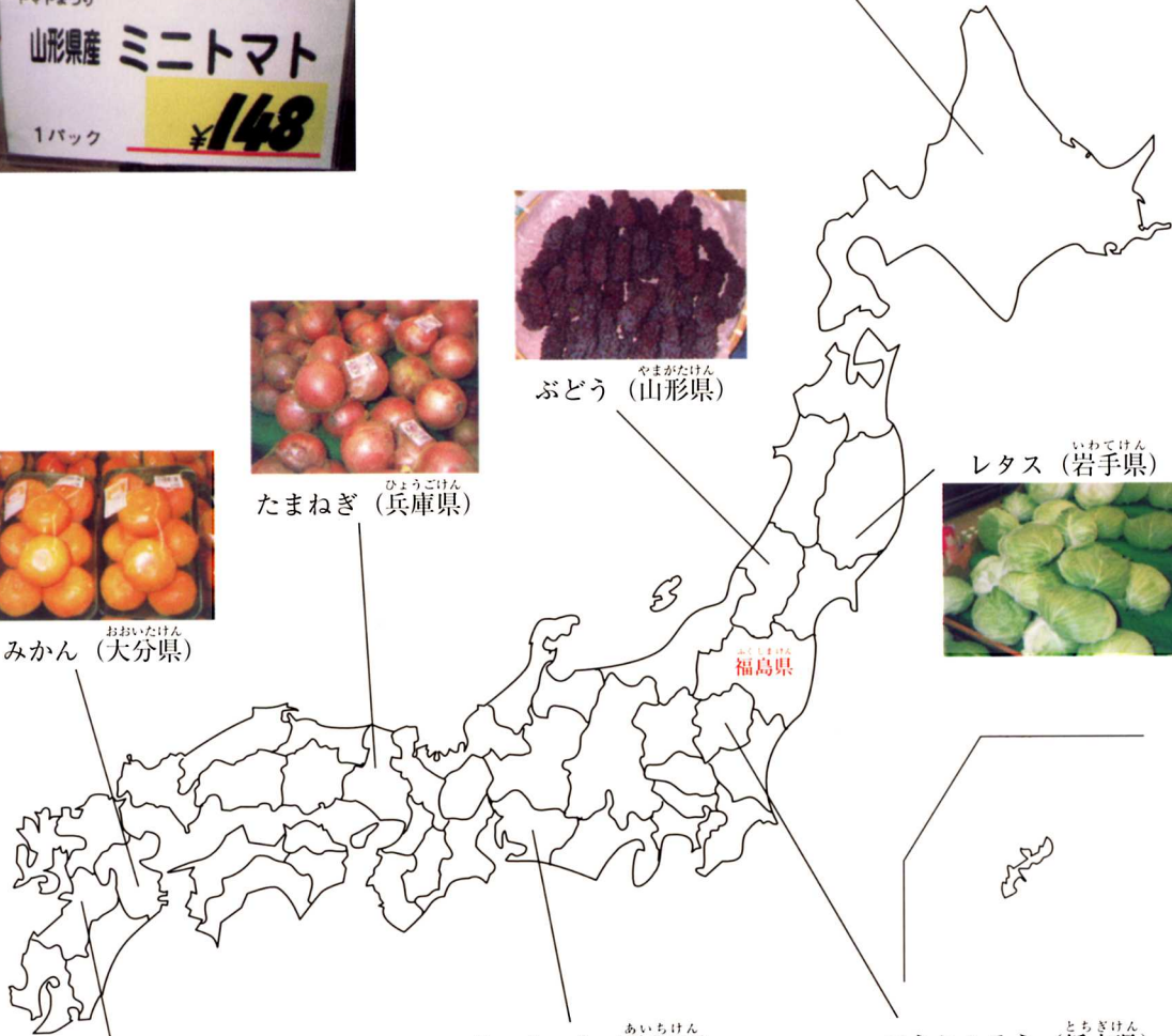
さつまいも (愛知県)