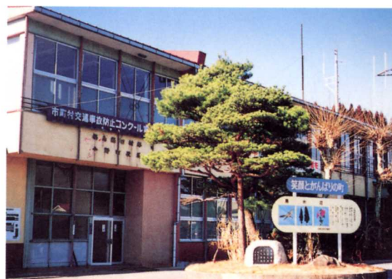
今の郵便局の所 ゆうびんきょく ・横町