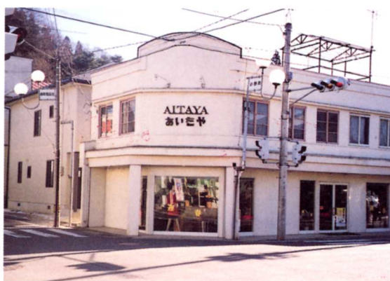
小野新町・横町交差点