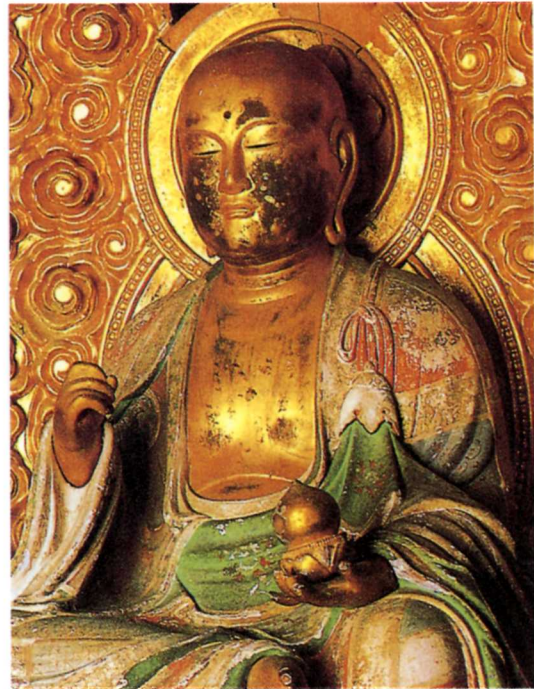
もくぞう じぞう ぼさつほん かぞう 木造地藏菩薩半跏像