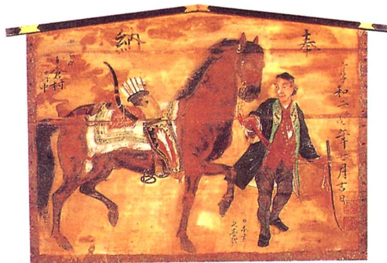
えま ゆさい ようじんひきうます 絵馬（油彩，洋人曳馬図）