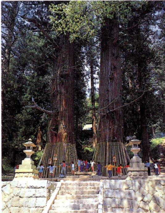
すわじんじゃ じじすぎ ぼぼすぎ 諏訪神社の翁杉・媼杉