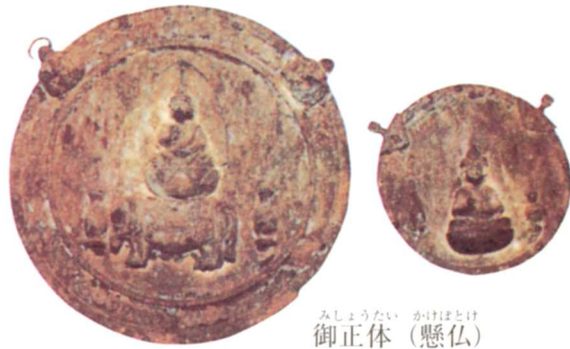
みしょうたい かけぼたけ 御正体 (懸仏)