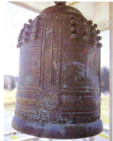
くどつかはんりやう 久戸塚半鐘