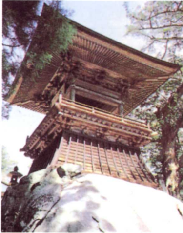
とうとうさんしやうろう 東堂山鐘楼