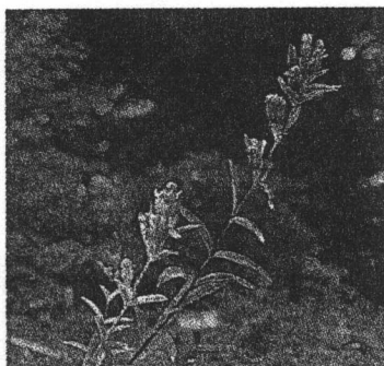
りんどう 愛情を象徴する花です。