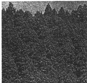
すぎ いきおいと理想を象徴する木です。