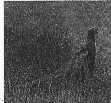
きじ 美しさとふれあいを象徴する鳥です。