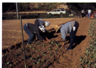
いちご苗の植えつけ