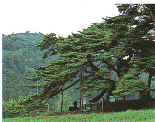
こうやまく 高野作の笠松(町指定天然記念物)