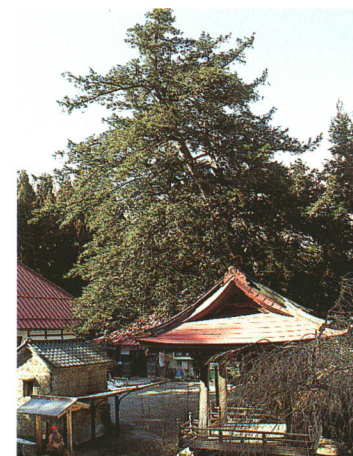
観照寺の大カヤ(県緑の文化財指定)

The gently sloping crests of the Abukuma range display the beauty of the four seasons. Cherry blossoms and ancient trees which have received prefectural and municipal designations as natural treasures along with the subtle murmuring of the Otakine and Makino rivers make you feel that nature is always close at hand.