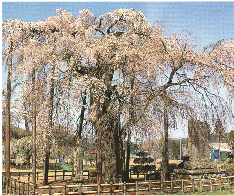
永泉寺の桜(県指定天然記念物)