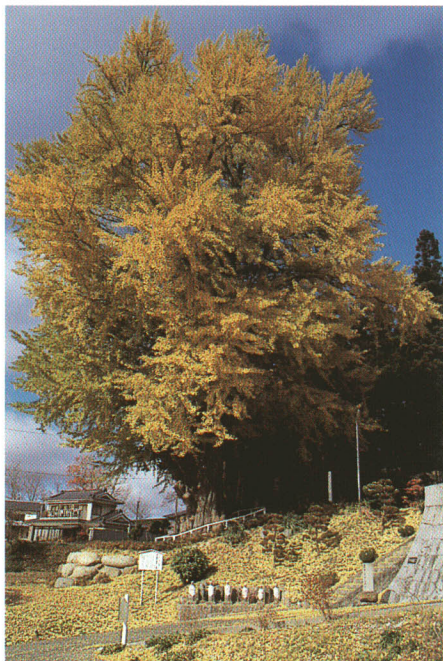
長源寺の大イチョウ(町指定天然記念物)