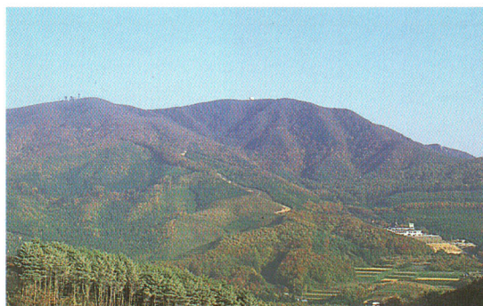
大越町から望む大滝根山

The gently sloping crests of the Abukuma range display the beauty of the four seasons. Cherry blossoms and ancient trees which have received prefectural and municipal designations as natural treasures along with the subtle murmuring of the Otakine and Makino rivers make you feel that nature is always close at hand.