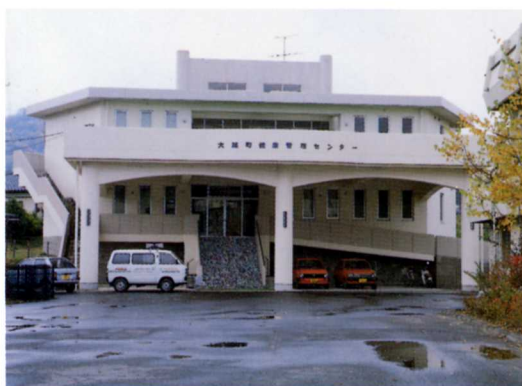
けんこうかんりセンター