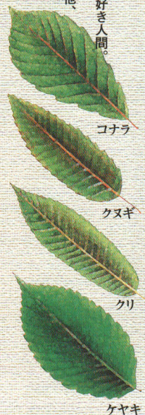
鎌倉岳周辺で見られる落葉広葉樹（例）