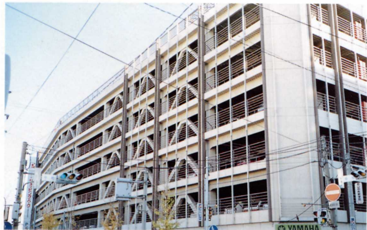
りったいしゃじょう 立体ちゅう車場

郡山には、5つの鉄道と、たくさんの道路が集まっているので、田村郡や須賀川市、二本松などからもたくさんの人が買い物にやってきます。