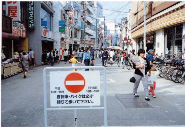
ほこうしゃてんごく 歩行者天国