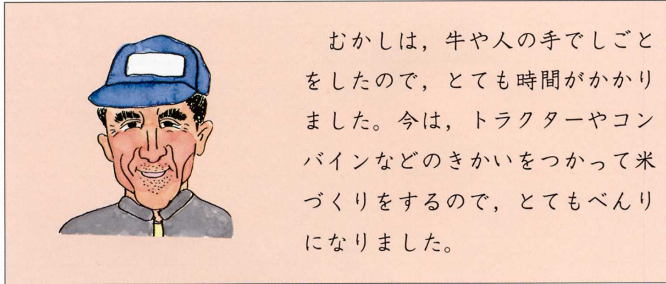
昔と今の水田のしごと すいでん (10アールにかかる時間)