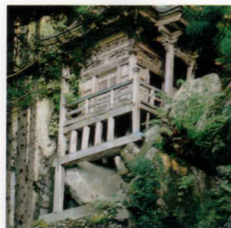
いそぎき 磯前神社

今から700年 前にたてられた 城をよみがえら せました。 今はたて公園と なっています。