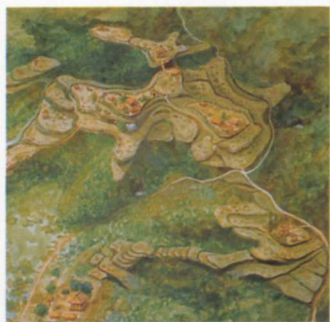
ときわじょう 常盤城のあと

今から700年 前にたてられた 城をよみがえら せました。 今はたて公園と なっています。