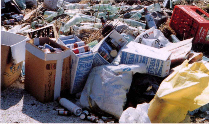
▲ 集められたもえないごみ

もえないごみの しゅうしゅうび 収集日に集められたもえないごみは、あきかん・あきびん等に分けられます。