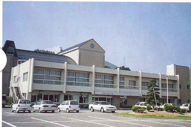
船引町中央公民館