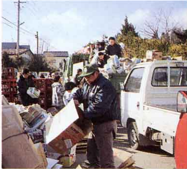
しげんかいしゅう