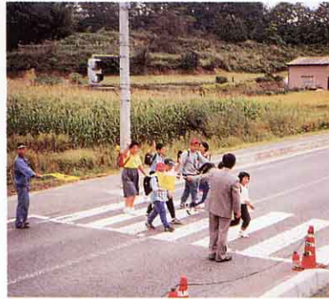
こうつうあんぜんうんどう 交通安全運動