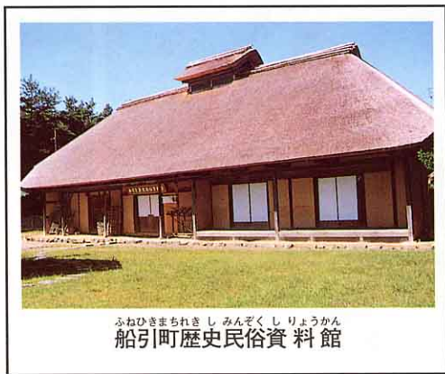
ふねひきまちれきし 民ぞくしりょうかん 船引町歴史民俗資料館