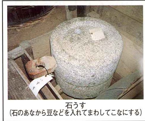
石うす (石のあなから豆などを入れてまわしてこなにする)