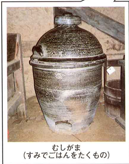
むしがま (すみでごはんをたくもの)