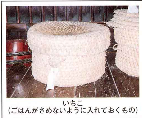
いちこ (ごはんがさめないように入れておくもの)