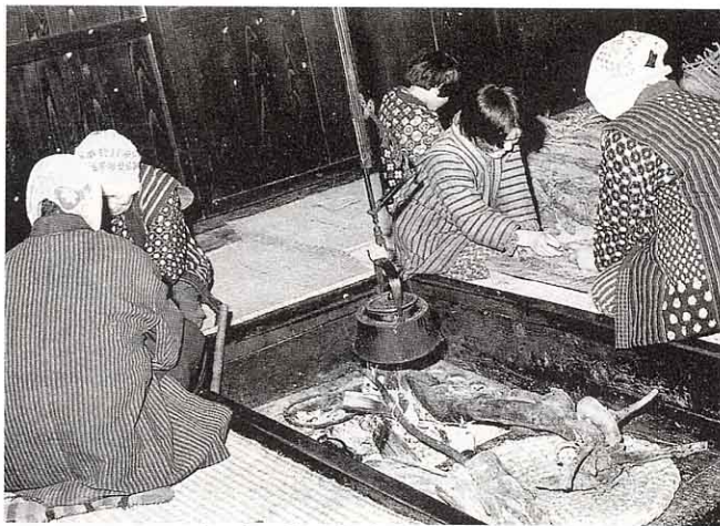
いま (いろりを中心としたへや) いろり (火をたいて湯をわかしたり、だんらんしたりした)

古い道具を使っていたころの写真を見せてもらいながら、おばあさんにお話を聞いてみましょう。