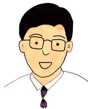
水道事業所のおじさん

町の水道は、昭和39年にはじめてできたんだよ。でんせん病をよぼうするために水道ができたよ。 みんなが安心してのめるきれいな水をたくさん送るようにしているよ。でも、水はかぎりあるものだからむだづかいしないで大切に使ってね。