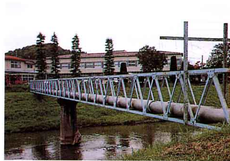
はいすいかん 配水管