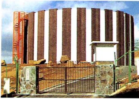
はいすいち 配水池