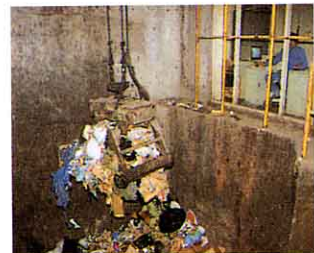
③クレーン ごみをつかみ焼却炉に入れる。