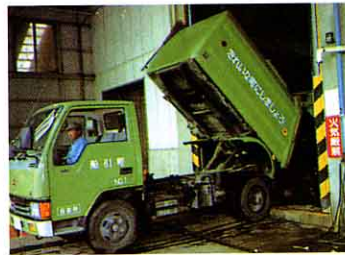
②プラットフォーム ここからごみを投入する。