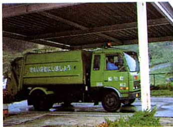
①トラックスケール ここでごみの重さをはかる。