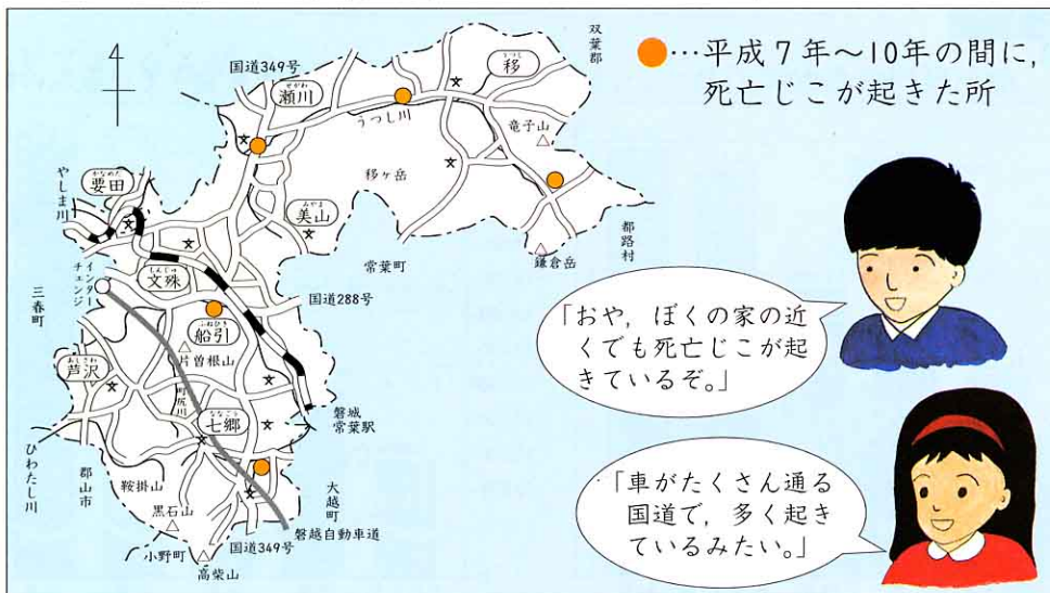
船引町内で死亡じこがあった所