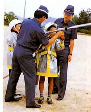
少年消防 | 日体験