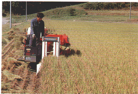
稲刈り機 （コンバイン）