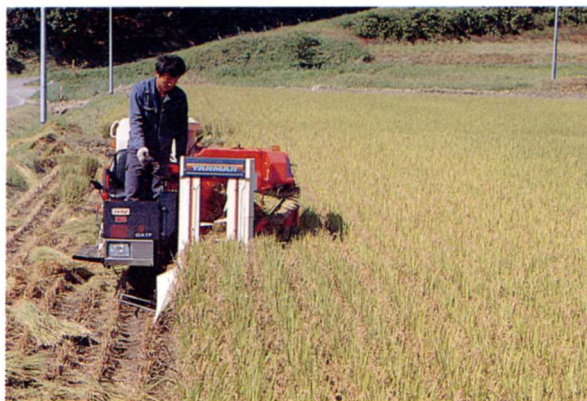
稲刈り機 （コンバイン）