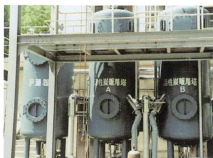
▲高度しよりせつび