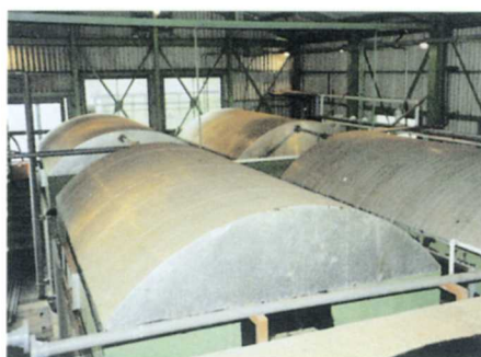
◀回転円板式生物しよりそうび