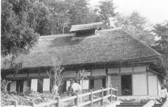
むかしの農家（関の森公園）