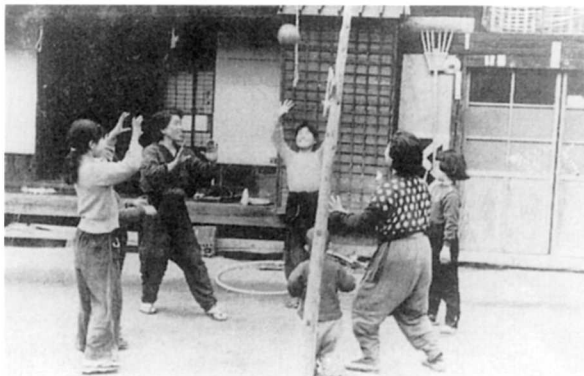
▲昭和34年頃の女性のふだん着