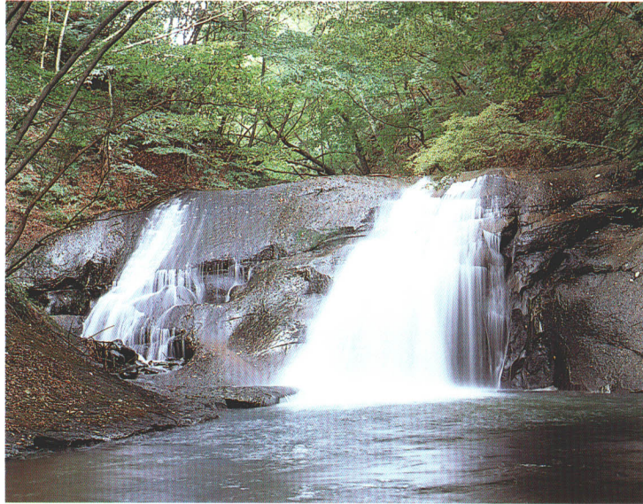
西の郷遊歩道・夫婦滝

The Abukuma River runs directly through Nishigo. Near the river, there are many beautiful canyons and ravines to enjoy. In addition, there are a large number of natural hot springs residing within the canyons and ravines, adding to its natural beauty.