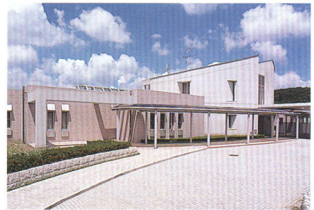
保健福祉センター

高齢化、少子化が進んでいます。誰もが生涯を通じて健康で明るく安心して暮らせる長寿社会の実現は、みんなの願い。そのための保健、医療、福祉の一層の充実を図ると同時に、高齢者の豊かな経験や知識、技術を伝える場と機会の整備を図ります。