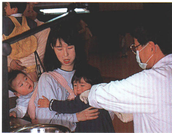
乳幼児の予防接種