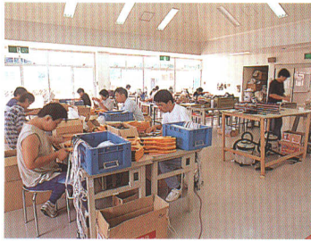
授産施設『甲子の里希望の家』