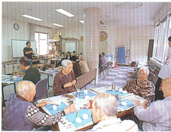
デイサービスセンター『やすらぎの家』