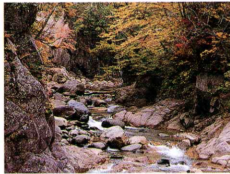
あぶくまがわけんりゅう 阿武隈川源流