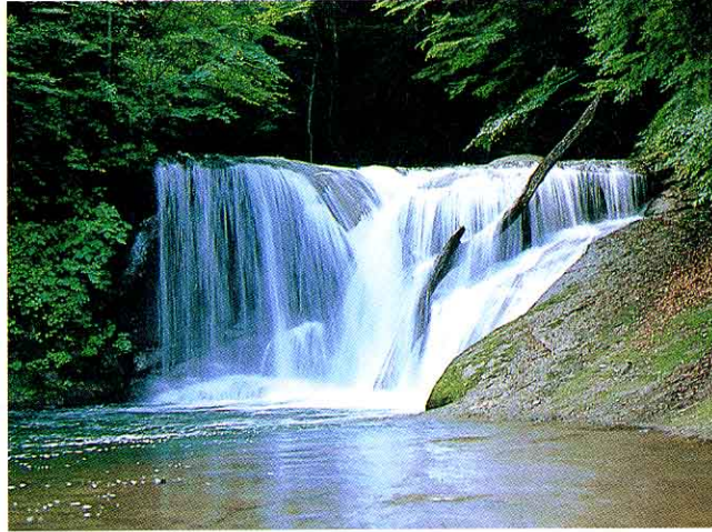
いっきゅう たき 一休の滝