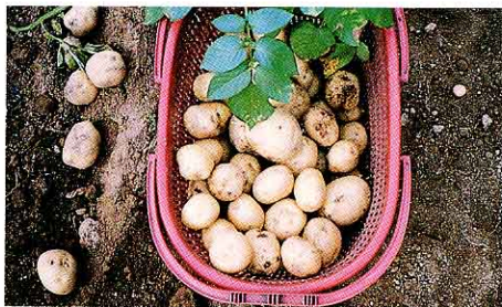
しゅうかくしたじゃがいも

じゃがいもをつくる畑は、一度使ったら、あと3年間は休ませなければなりません。その3年間というのは、牛のえさとなる牧草 ぼくそう をつくりたりしているんですよ。じゃがいもづくりは、らく農（牛などを育てて肉や乳をつくる農業）と深いつながりがあるので