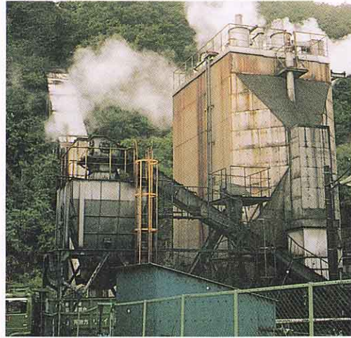
ごみしょうきゃく場