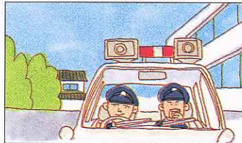
防火をよびかける