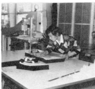
④ 洋ふくの形に切っている