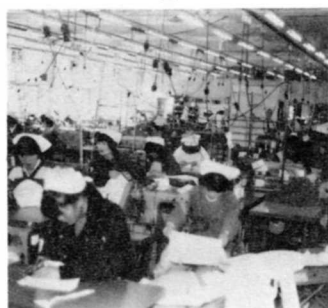
⑤ ミシンで洋ふくをぬっている