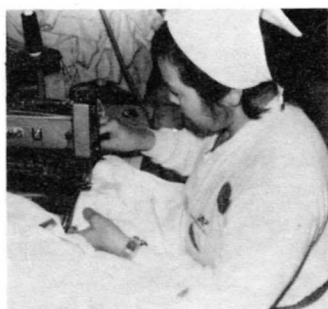
⑥ ボタンをぬいつけている