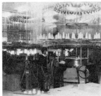
② ぬの地をつくっている