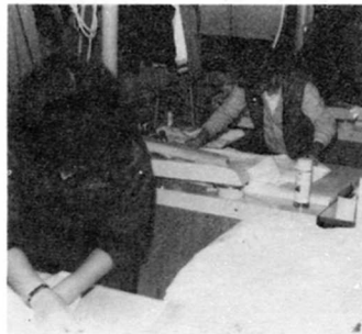
⑧洋ふくをたたんでしあげている