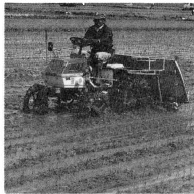
田植えきによる田植え