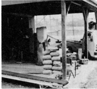
機械利用組合での作業

るので、農家にとっては、たいへんです。何げんかで、きょうかして買ったり、よその家や団体にたのんで、田植えや、いね