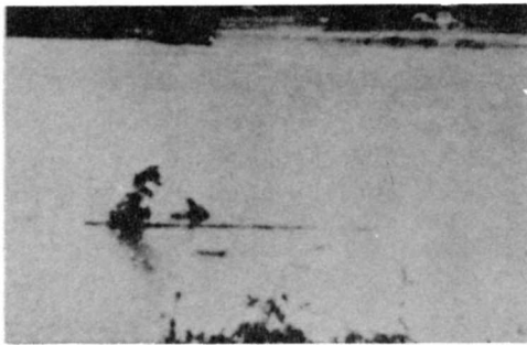
昭和36年阿武隈川のはんらん

阿武隈川のはんらん 昭和二十二年 二十三年ごろ、阿武隈川の水があふれ 田や畑が水にひたり、いねたばが流さ れるひ害がありました。 代畑から石川町へ行く道路は、不通 となり、石川方 面への通きん者 や通学者は、休 まなければなら なかったとい う ことです。