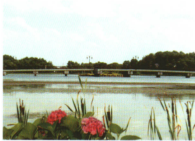
整備がすすむ大池公園