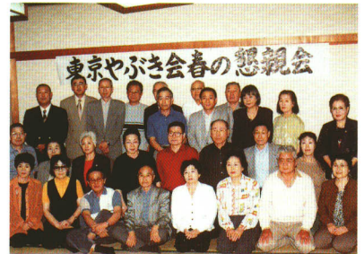
東京やぶき会発足