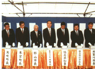
阿武隈川流域下水道処理場完成