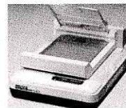
イメージスキャナー

カメラをつくる工場は、矢吹町のほかに東京、埼玉、栃木、 宮城、山形、そして外国 (台湾、香港、フィリピン、ベトナム) にもあり、部品やせい品が毎日送られて います。今は、カメラよりも事務機 器の生産の方が多くなっています。