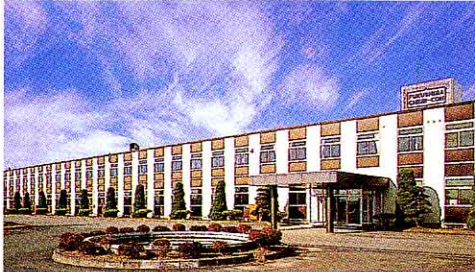
電気きかい器具を作る工場 (丸ノ内)