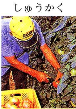
(色・形をよく見てとる)