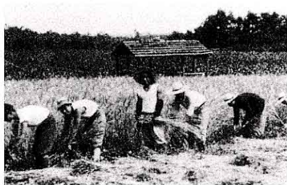
かまでいねをかる