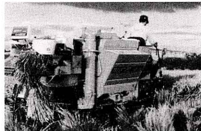
コンバインでいねをかる