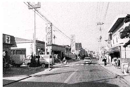
昭和53年矢吹町中町通り