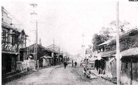
昭和5年ころ矢吹町中町通り