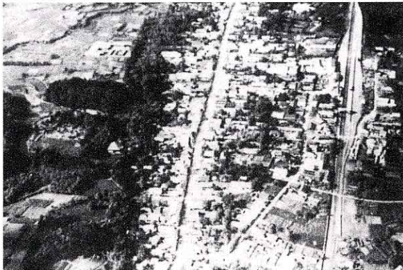
昭和10年、矢吹町の中心地