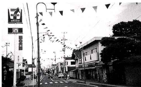
平成11年矢吹町中町通り