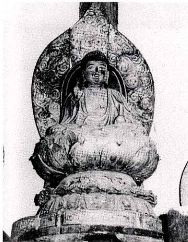
やくしにょらいごぞう ちようとくじ たかはやし 薬師如来座像<長徳寺>(高林)