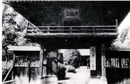
ちようこうじ さんもん もと 澄江寺山門 (本村)