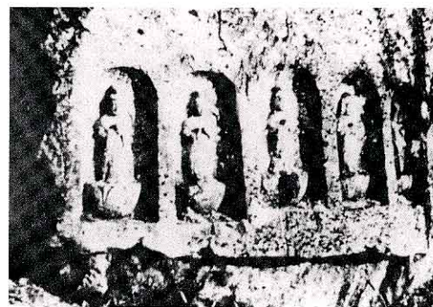
さんじゅうさんかんのん ぶつ たき まん 三十三観音まがい仏 (滝八幡)