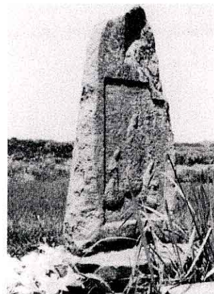
あみだにょらいさんぜんくようとう さんじょうめ 阿弥陀如来三尊供養塔 (三城目)