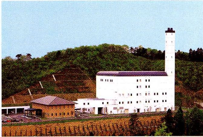
西白河地方クリーンセンター

ば 場所 白河市 かめいし 亀石1番地 のう 能力 1日 120 t かん 完成 平成7年3月 こう 工事費 およそ71億5千万円