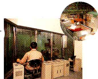
クレーン き そう作室 (ごみをごみホッパへ入れる)