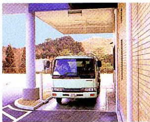
ごみ計量き(ごみの重さをはかる)