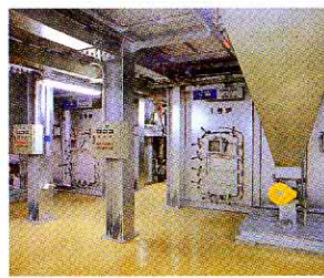
しょうきやく ろ 炉