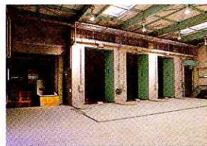
プラットホーム (ここからごみピットへ投入する)