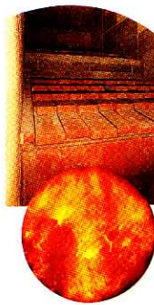
68 しょうきやく ろ 炉内 (800~950℃の高温で しょうきやくする)