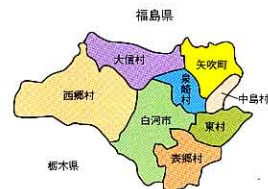
くみあいこうせい 組合構成市町村

8つの市町村が協力して、ごみの しゆえゆう 収集・ しより 処理をすすめています。