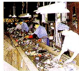
あきかんやびんを分ける