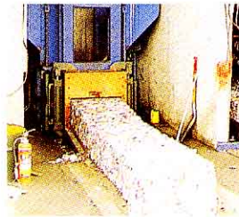
あきかんはアルミ、スチールに分け、プレスする。