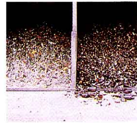
びんは色べつにする