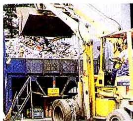
集められたもえないごみ