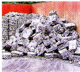
プレスされたアルミかん (ひとつ25kg)