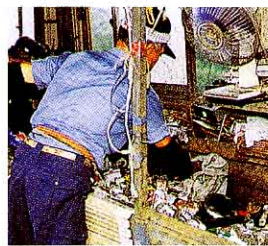
ビニールぶくろなどをとる