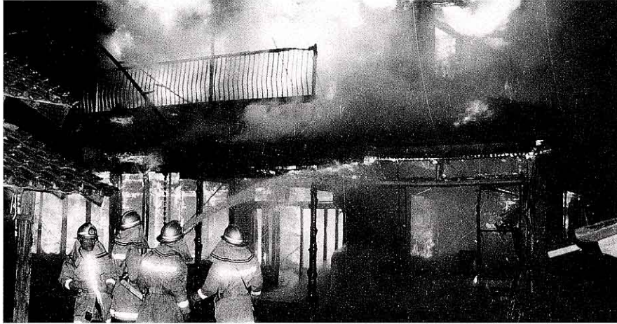
矢吹町でおきた火事のうつりかわり