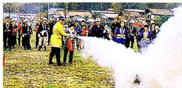
しょうか 消火くんれん