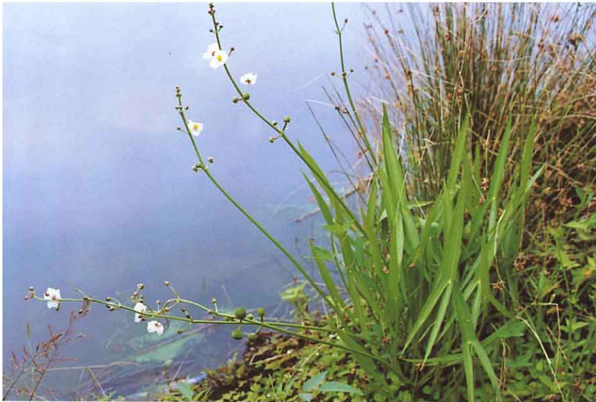
◀ あぎなし (おもだか科)

葉はすべて根もとからでる。 オモダカによく似ているが葉 の裂片の先が少しまるくなっ ている。