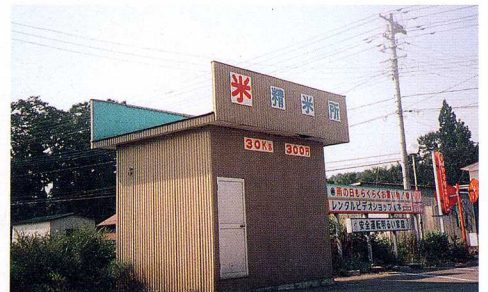
せいまいじょ 精米所