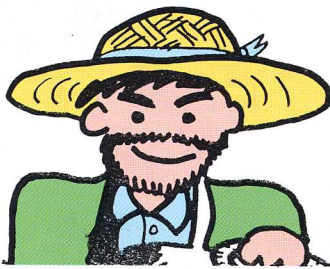
ニラをつくるおじさん

表郷村のニラづくりは、20年前ごろから始まりました。しゅうかくりょうがとても多くて、福島県の中で一番です。ニラは、一度かりとっても、20日もたてばまたしゅうかくできます。かりとるたびにおいしいニラが育ちます。仕事はたいへんだけど、よろこびもいっぱいあじわえます。