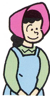
しゅっか場のおばさん

北海道は、雪がたくさんふります。あまりそだたないのです。ニラを買んに3たばとか4たばとか買うと聞いてそれでFGフィルムには入れないで