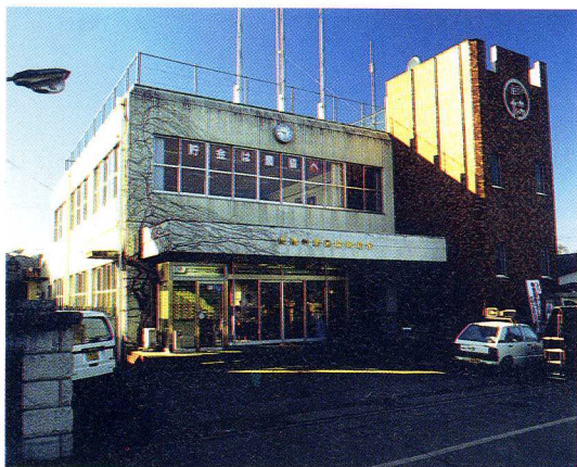
表郷村農業協同組合

す。 東京の方に住んでいる人は、家族かそくが多いし、電車で買い物に行く人もいたばずつ買うことが多いそうです。かたちも、FGフィルムにつつんで送す。